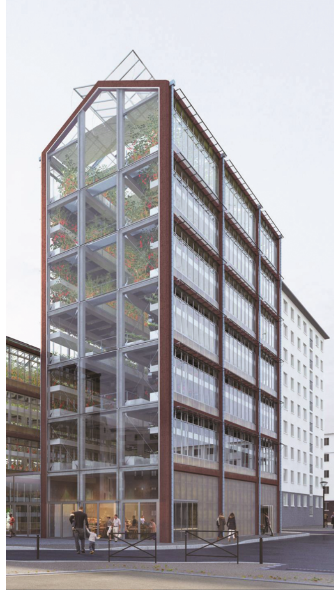
Tour maraîchère de ROMAINVILLE (93)

Notre savoir-faire, créatif, audacieux et concret progresse par chaque projet innovant, par des formations continues, par la curiosité de chacun et nous permet de concevoir la ville de demain.